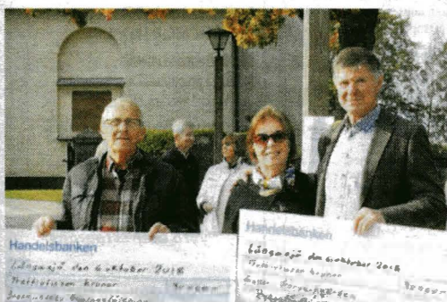
Galleri Garvaregården och Ingemundebo Bylagsförening fick årets sockengåva.